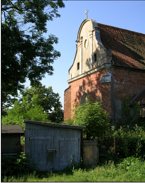
Rys. 5. Kościół p.w. św. Mikołaja i jego najbliższe otoczenie