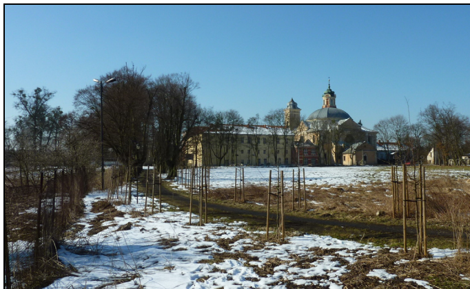
Rys. 3. Fragment dawnego ogrodu konwentualnego otaczający zespół klasztorny w Owińskach

Fig. 3. A fragment of the former convent garden surrounding the monastery objects in Owińska