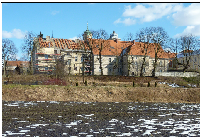
Rys. 4. Wartski ogród stanowiący przedpole widokowe dla zabudowy klasztornej

Fig. 3. A fragment of the former convent garden surrounding the monastery objects in Owińska