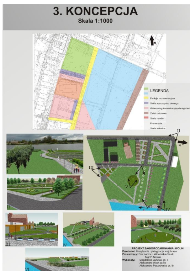
Rys. 3. Możliwości kształtowania krajobrazu miejskiego Wolina Fig. 3. Possible concepts of the Wolin city landscape development