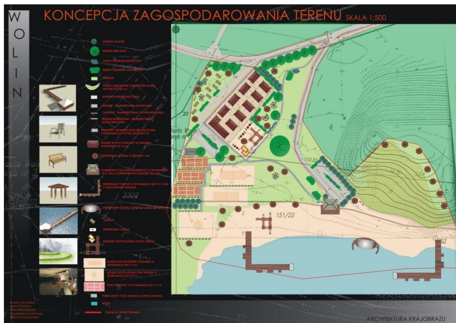
Rys. 5. Projekt zagospodarowania terenu plaży Fig. 5. The project of the beach area development