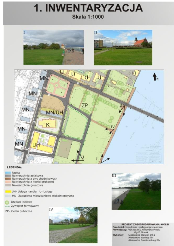
Rys. 2. Plan i widoki nabrzeża rzeki w centrum miasta Fig. 2. Plan and the river embankment views in the city centre

Zagospodarowanie centralnego obszaru miejskiego w kontekście uwarunkowań rozwoju turystycznego powinno koncentrować się na podniesieniu atrakcyjności głównego obszaru w mieście poprzez rewaloryzację krajobrazu. Istotne elementy do wprowadzenia to promenada nad rzeką z miejscami widokowo-wypoczynkowymi, wprowadzenie kompozycji zieleni istotnych dla uzyskania harmonii krajobrazu, modernizacja terenu poprzez nowe funkcje terenu (teren imprez masowych, elementy małej gastronomii), kompozycja wnętrza krajobrazowych i panoram, zastosowanie zieleni osłonowej, kompozycji kwiatnych, głównie na rabatach na placu przed ratuszem, wykształcenie ciągów pieszych prowadzących z centrum i z placu na bulwar nadrzeczny, utworzenie otwartych i punktów widokowych na rzekę, wyspę i okolice, a także uporządkowanie panoramy miasta (rys. 3).