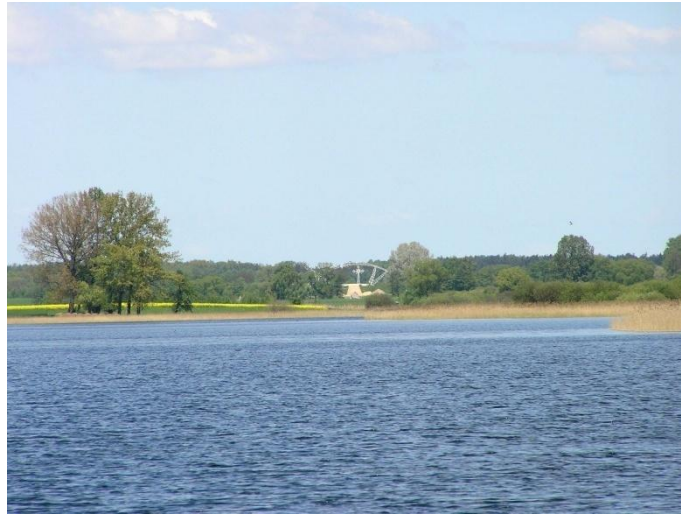
Rys. 1. Brama III Tysiąclecia widziana z przeprawy promowej na Ostrów Lednicki