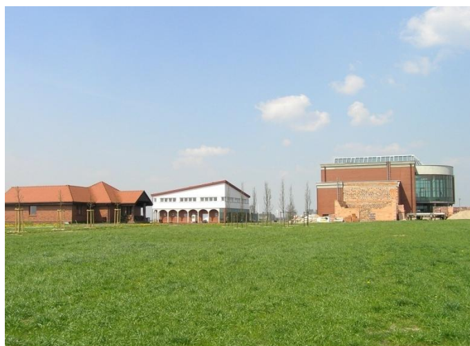
Rys. 3. Trzy budynki stojące obecnie na polu duszpasterstwa