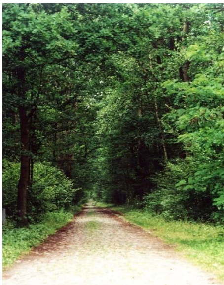
Rys. 4. Brukowana droga łącząca folwarki w Imiołkach, Kamionku i Zakrzewie

W pierwszym okresie funkcjonowania ośrodka duszpasterskiego drogi wiodące bezpośrednio do niego były nieutwardzone, część o poboczach porośniętych bogatymi zadrzewieniami. Obecnie wszystkie drogi w okolicach pola, poza jedną, są pokryte asfaltem. Także wiodące przez las stare, brukowane drogi, łączące dawniej okoliczne folwarki (rys. 4, 5). Zadrzewienia śródpolne towarzyszące głównej drodze doprowadzającej do miejsca zgromadzeń usunięto.