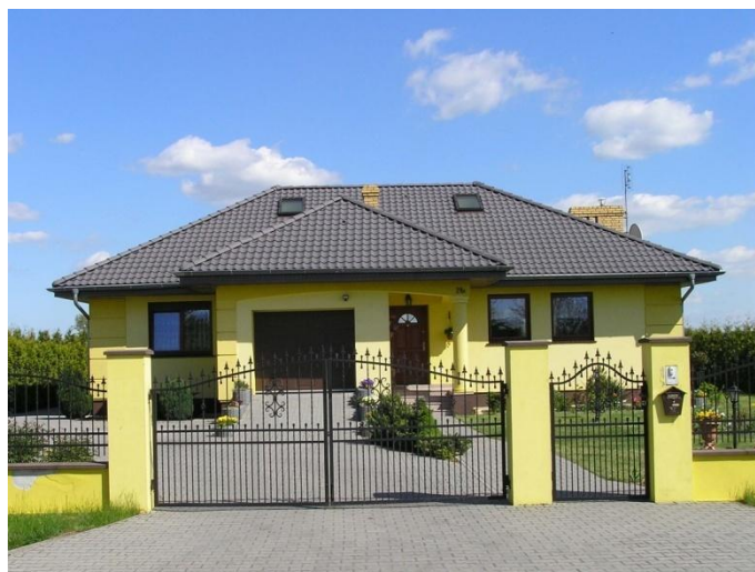
Rys. 6. Przykład nowej zabudowy wsi nad jeziorem Lednica

„dworkowych” formach (rys. 6). Towarzyszą im ogródki z całym bogactwem roślin iglastych i egzotycznych. Kolidujące z nowymi obiektami historyczne zabudowania są rozbierane. Przepadają szczególnie cenne dla chronionego krajobrazu kulturowego charakterystyczne dla regionu formy budynków, zabudowania folwarczne i elementy dawnej infrastruktury. Radykalnie zmienia się oblicze lednickich wsi (CHOJNACKA i WILKANIEC 2003).