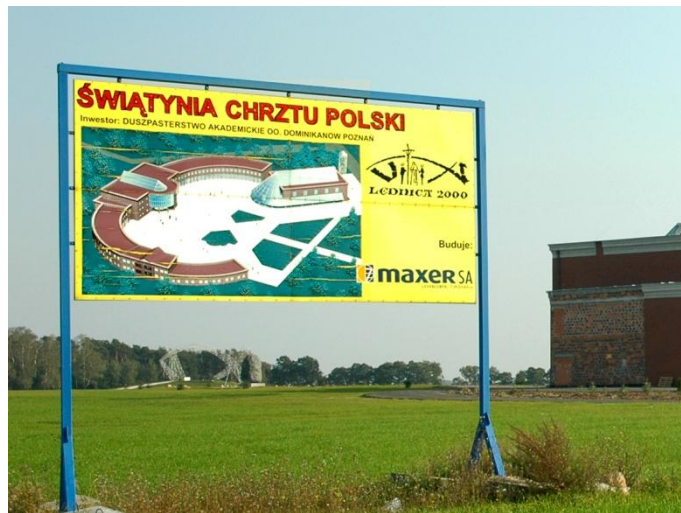
Rys. 2. Pierwotna wersja głównego budynku na polu w Imiolkach