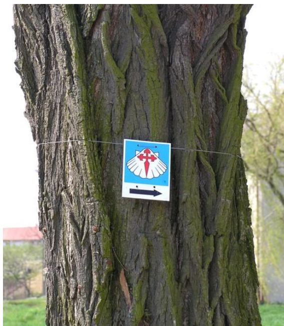
Rys. 7. Oznaczenie drogi Św. Jakuba Fig. 7. Road sign in St. James' road

W 2007 roku na ziemi lednickiej wytyczono odcinek szlaku św. Jakuba wiodącego z Gniezna do Poznania. Prowadzi on wokół północnej części jeziora Lednica i przebiega w pobliżu ośrodka w Imiołkach. Drogi św. Jakuba pokrywają siecią całą zachodnią Europę i wiodą do Santiago de Compostella. Tysiącletnia tradycja wędrowania drogami jakubowymi ożyła na nowo w połowie lat osiemdziesiątych XX wieku i sięgnęła Wielkopolski. Nastąpiło to po wizycie Jana Pawła II w Santiago i apelu Rady Europy o otwarcie i utrzymanie dawnych szlaków pielgrzymkowych jako pierwszych europejskich dróg o znaczeniu dla kultury Kontynentu (CEGLIŃSKA i IN. 2006). Symbolem pielgrzymy jest charakterystyczna muszla. W zbiorach MPP na Lednicy znajduje się kopia znalezionej na Ostrowie muszli pątniczej, z otworami dla zamocowania na odzieży. Miejsce znalezienia muszli świadczy o wykorzystywaniu traktu z Gniezna do Poznania przez Ostrów także przez pielgrzymujących do Santiago. W terenie oznaczono szlak charakterystycznymi plakietkami, które są dobrze zauważalne ze względu na formę odmienną od tradycyjnych oznaczeń szlaków (rys. 7). Nowo powstały szlak, dzięki opisującej go publikacji, jest już uczęszczany przez pielgrzymów także z odległych stron świata (m.in. z Chile), zatrzymujących się w okolicznych gospodarstwach agroturystycznych, przyczyniając się do popularyzacji kolebki polskiego chrześcijaństwa.